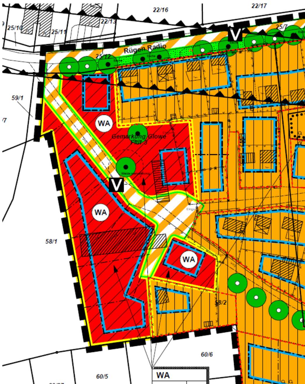
Rot: Darstellung gemeindliche Flächen WA