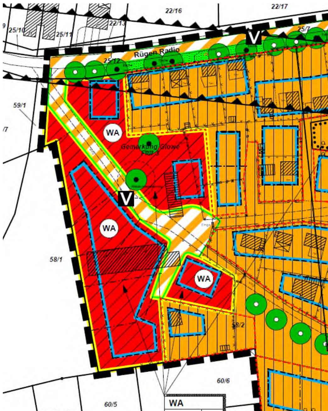
Rot: Darstellung gemeindliche Flächen WA