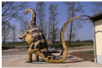
Majestätisch und imposant. Dinosaurier auf Rügen.