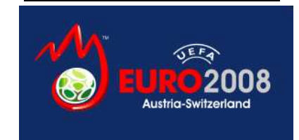
TV Live- Übertragungen während der Fußball- EM 2008 auf dem Kurplatz Glowe.