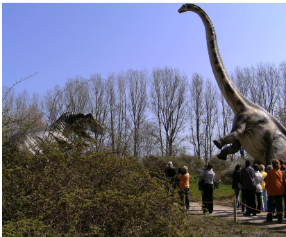
Fleischfresser gegen Vegetarier. Wer da wohl gewinnt ?