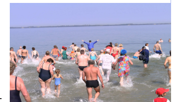
Startschuß um 11:11 Uhr !

der DGzRS, dem DRK , der Wasserwacht, der Gemeinde Glowé und dem Eiscafé Arkonablick für ihre tatkräftige Unterstützung. ( DT )