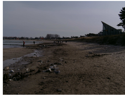
Der Glower Strand (flach wie Brett) nach dem Sturm am Ostertag 2008 in östlicher u. westlicher Richtung.

Sonne , Strand und Meer, Werbeslogan im neuen Ortsprospekt von Glowe. Aber das allein reicht nicht. Der Strand und die Düne in Glowe schrumpfen. Und das schneller, als uns lieb ist. Der letzte große Sturm zu Ostern hat wieder gezeigt, wie anfällig die Schutzdüne ist, wenn die Sandvorspülung fehlt bzw. abgetragen und weggespült ist. 3-5 m Dünenverlust, von der Höhe des Strandes ganz zu schweigen. Hier fehlen teilweise bis zu 2,50m Strandhöhe. Bei normalem Wasserstand und nicht auflandigem Wind kein Problem, aber bei N- und NO-Wind ab 4-5 Windstärken heißt es „Land unter „ am Strand . Die im letzten Sommer durchgeführten Dünensicherungsmaßnahmen ( Dünenanschrägung und Neubepflanzungen ) waren auch nur kosmetischer Natur und werden z.Zt. wieder durchgeführt. Und die kosten wieder viel Geld. Irgendwann muss man doch zur Einsicht gelangen, das hier andere Maßnahmen sinnvoller wären ( Bühnenbau, künstliches Riff, Dünenvorspülung etc.). Nordstrände wie in Glowe sind Erosionsstrände und sind anfällig bei N-und NO-Winden. Das hat die Vergangenheit gezeigt. Wenn Glowe weiterhin ein touristischer Badeort bleiben will, besteht hier dringender und nachhaltiger Handlungsbedarf.